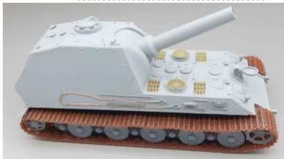
ドイツ 30.5cm自走砲 ベア