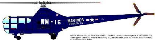
A U.S. Marine Corps Sikorsky HO3S-1 Marine headquarters coaction HEDRON 33. The 7 figure "Headquarters Marine Air Group 33, parked near tanks at Ichiwan, South Korea, on 13 December 1952.