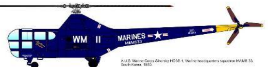
A U.S. Marine Corps Sikorsky HO3S-1, Marine headquarters coaction H4M3 33, South Korea, 1955.