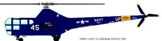
HO3S-1 of H4-1st USS Bower (CV-21) 1954