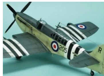
スペシャルホビーの1/48ファイアフライFR Mk 5の作例 ←