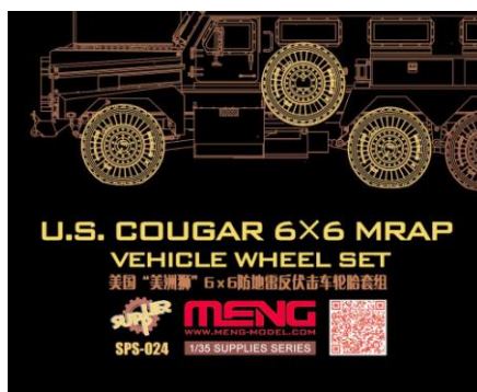
MENTS-024 クーガータイヤセット

タイヤはレジン製でハブも精密に再現、タイヤのトレッド、自重変形もリアルにモデル化。自重変形タイヤ6個とスペアタイヤ2個入り