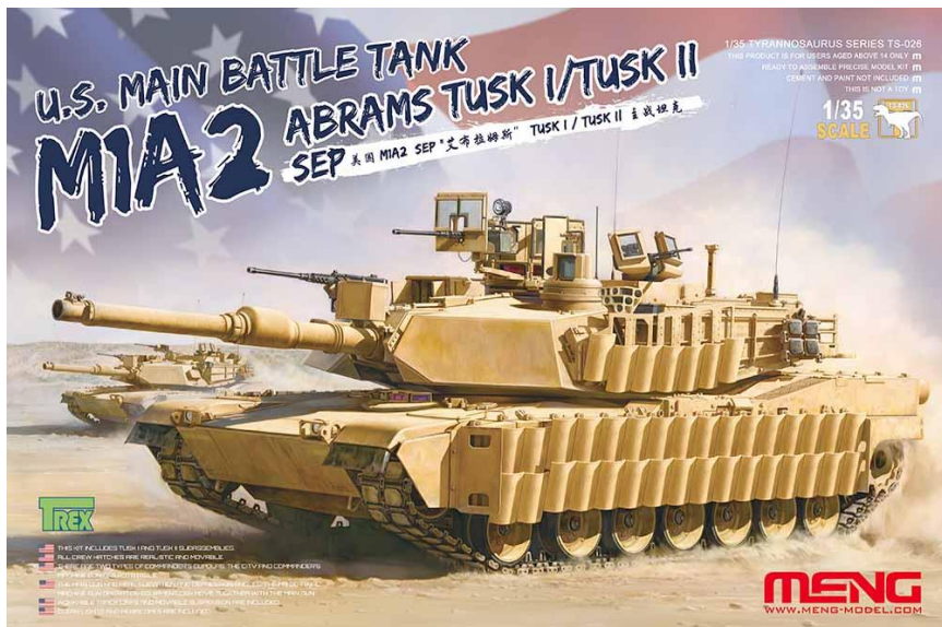
M1A2 SEP TUSK I

M1は1980年に採用、更に1985年から導入されたM1A1では以前の105mmライフル砲を120mm滑空砲に拡大しました。M1A2では更に防御力等が強化されました。SEPは改修計画(System Enhanced Package)の略で1999年より旧型となったM1やM1A1を改修していきました。TUSK I(Tank Urban Survival Kit)は市街戦への対応キットで装甲タイル、ハッチ周辺の盾などが装備されました。TUSK IIでは瓦型の装甲タイルが追加装備されました。実戦には1991年の湾岸戦争、2003年のイラク戦争、2009年のアフガニスタンにも投入されたとされています。