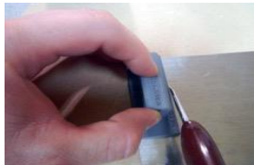
1:カッティングガイドを使いシートをプレス用パーツの大きさに切ります。

ザ・コラゲーターは薄い金属板などをコラゲート板(波板)に成型するツールです。レジン製のカッティングガイドとプレス用のパーツと金属シート(A4)1枚のセットです。ダイオラマの作成時に役に立つ便利ツールです。従来品の1/35に新商品の1/72、1/48、1/24、1/16も新たにライナップされました(どのスケールも波の形状は同じでサイズのみ異なります)。