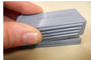
2:切り出したシートをプレスして波板が完成です。