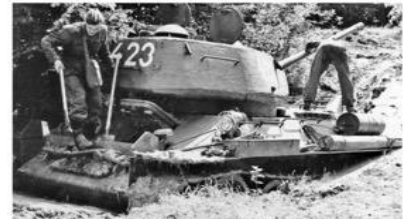
Experimentální tank T-34B2 s československým motorem Zbrojovka Brno a slovenským 82 mm náboje 450 mm kalibru 1200, vyrobený v roce 1945. Tank předvedl svůj výkon 1945 v Praze. T-34B2 tank from production of Brno Factory (Zbrojovka Brno) during military in the military unit of Prague. The machine with number 453 and national emblem of the ČSRP on the side of the turret was introduced in 1945. The tank presented arranged in the 1945 PT.