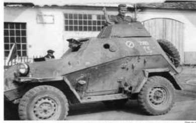
Vojsko BA-66 (PT-76) motorizovaný průmysl automobilů (1). Čs. armáda získala první 4 kusy 8. srpna 1945 v zájmovém území. This BA-66 belonged to the Motorized Battalion of the 1st Co. Independent Tank Brigade and was photographed on May 5, 1945 in Prague 1945.