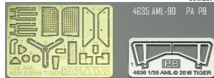
4635 AML-90 PA PB 4635 1/35 AML © 2018 TIGER

AML装甲車はフランスのパナール社が1960年に開発を開始した四輪の装輪装甲/偵察戦闘車です。その機動性の高さから迅速な偵察行動と火力支援が可能で、フランス軍とジャンダルマリ(フランス憲兵隊)に制式採用された上に、輸出でも30ヶ国以上に導入されるなど商業的に大成功を収めました。AML装甲車の派生型は基本的に車体の構成は共通で、AMLの基本型となるAML-90はイスパノ・スイザ製のH90砲塔にGIAT製の33口径90mm低圧滑腔砲CN-90-F1と7.62mm機関銃を同軸に装備しています。