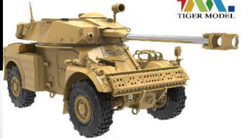
4635 AML-90 Metal Cannon and Gun