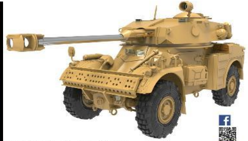
PANHARD AML-90 1/35 NO.4635