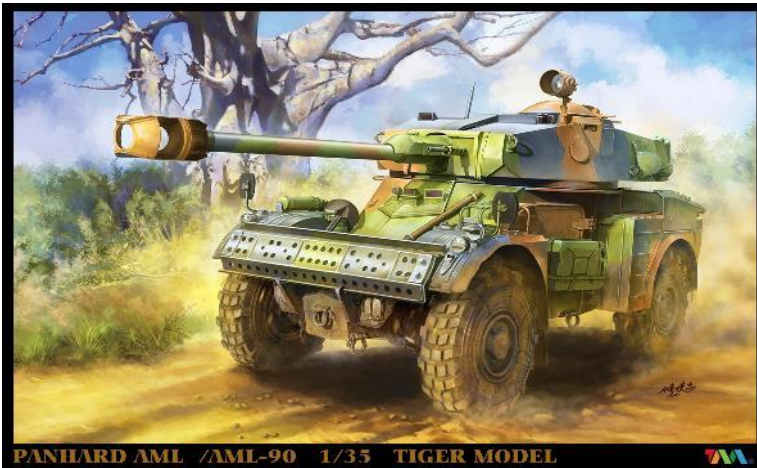
PANHARD AML /AML-90 1/35 TIGER MODEL