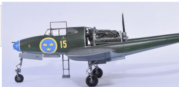
※組立例です(1/48 J21A本体は別売りです)