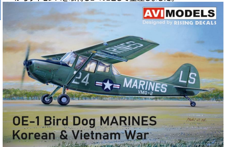
OE-1 Bird Dog MARINES Korean & Vietnam War

※O-1 バードドッグ実機諸元：・乗員：2名・全長：7.6m ・全幅：10.9m・エンジン：コンチネンタル O-470 213hp ・最高速度：209km/h・航続距離：1,296km