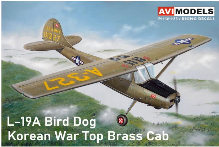
L-19A Bird Dog Korean War Top Brass Cab

チェコのAVIモデルから数量限定新製品の1/72スケールインジェクションキット2点ご案内です。どちらのキットにもエッチングパーツと複数種のデカールが付属しています。