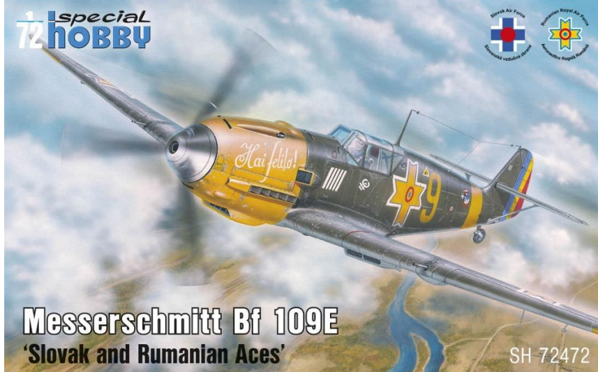
Messerschmitt Bf 109E 'Slovak and Rumanian Aces' SH 72472