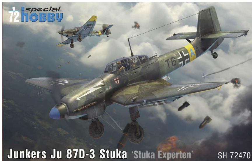
Junkers Ju 87D-3 Stuka 'Stuka Experten' SH 72470