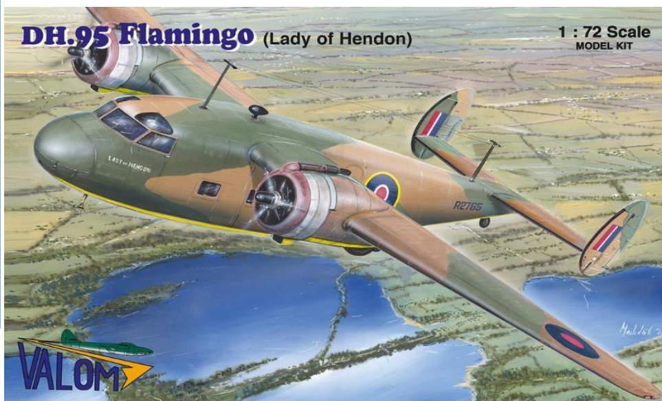
DH.95 Flamingo (Lady of Hendon)