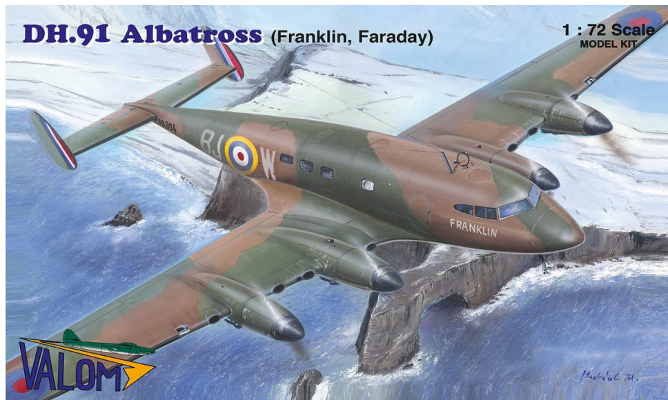
DH.91 Albatross (Franklin, Faraday)