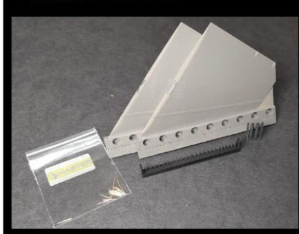
KSM 32036 F-16 Horizontal stabilizers