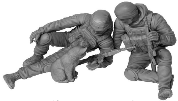
↑ 兵士2体と猫のセットです↑