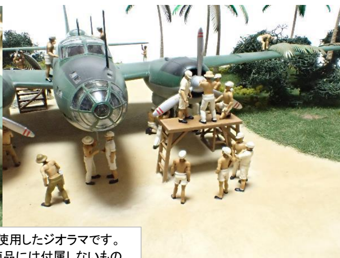
※ 画像は複数の試作品を使用したジオラマです。航空機や展示ベースなど商品には付属しないものや、実際の商品と異なる部分があります。

※ 本製品はUVレジン(3Dプリント)製です。組立てには瞬間接着剤が必要です。パーツにカケがある場合はパテ等で修正が必要となります。