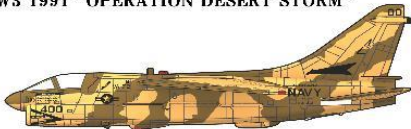
A-7E CORSAIR II VA-72 BLUE HAWKE USS JOHN F KENNEDY (CV-67) CVW3 1991 "OPERATION DESERT STORM"

艦上機の特徴ある主翼折畳状態の再現が可能。ODS(砂漠の嵐作戦)で試験的に施されたデザート迷彩を再現するためのマスクシールが付属します。