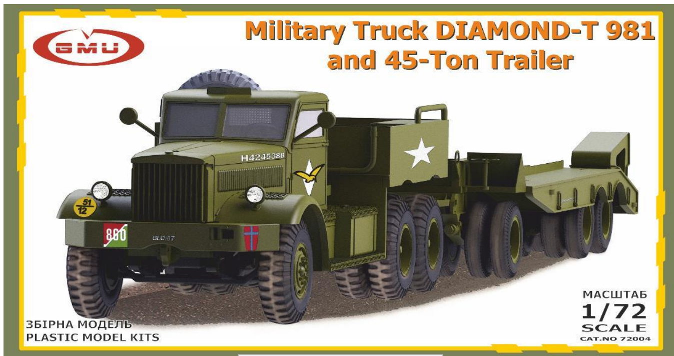
キットパーツの構成です(一部)

ウクライナのGMUモデルから 完全新金型 1/72 ダイヤモンド-T 981戦車運搬車w/45トントレーラーのご案内です。981戦車運搬車はアメリカのダイヤモンド-Tモーターが1941年～1945年の間に製造した、12t 6x4トラクターです。本車は45t 24輪トレーラーと組み合わせて、M19戦車運搬車として使われました。旧式のスクヤメルパイオニア戦車運搬車を配備していたイギリス軍の要請により開発されると、レンドリース法により直ちにイギリス軍に供与され、北アフリカ戦においてその性能を発揮しました。またM19戦車運搬車はソ連軍にも供給され、その性能を評価したソ連では事実上のコピーであるYaAZ-210Gを生産しました。981トラクターはフロントウィンチ付きの6輪のトラクターで、ハーキュリーズ DFxE ディーゼルエンジンで後部4輪を駆動することで、最大で54トン以上の牽引力を有しました。自重を差し引いても45トンの積載物を搭載可能な本車は、大戦中のアメリカ軍とイギリス軍のほとんどの装甲戦闘車量の運搬が可能な車両でした。このインジェクションプラスチックキットにはエンジンや走行装置、シャシーなどのディテールがリアルに再現されています。エッチングパーツと2種類(米軍、イギリス軍 x 各1)のデカールが付属しています。