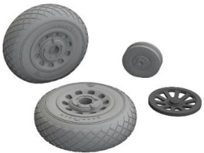
1/48 P-51B/C ホイール (ダイヤモンドトレッド)