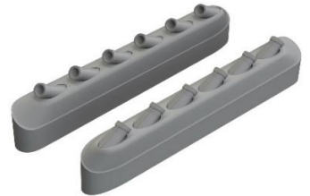
1/48 P-51B/C 排気管 (フェアリング付)