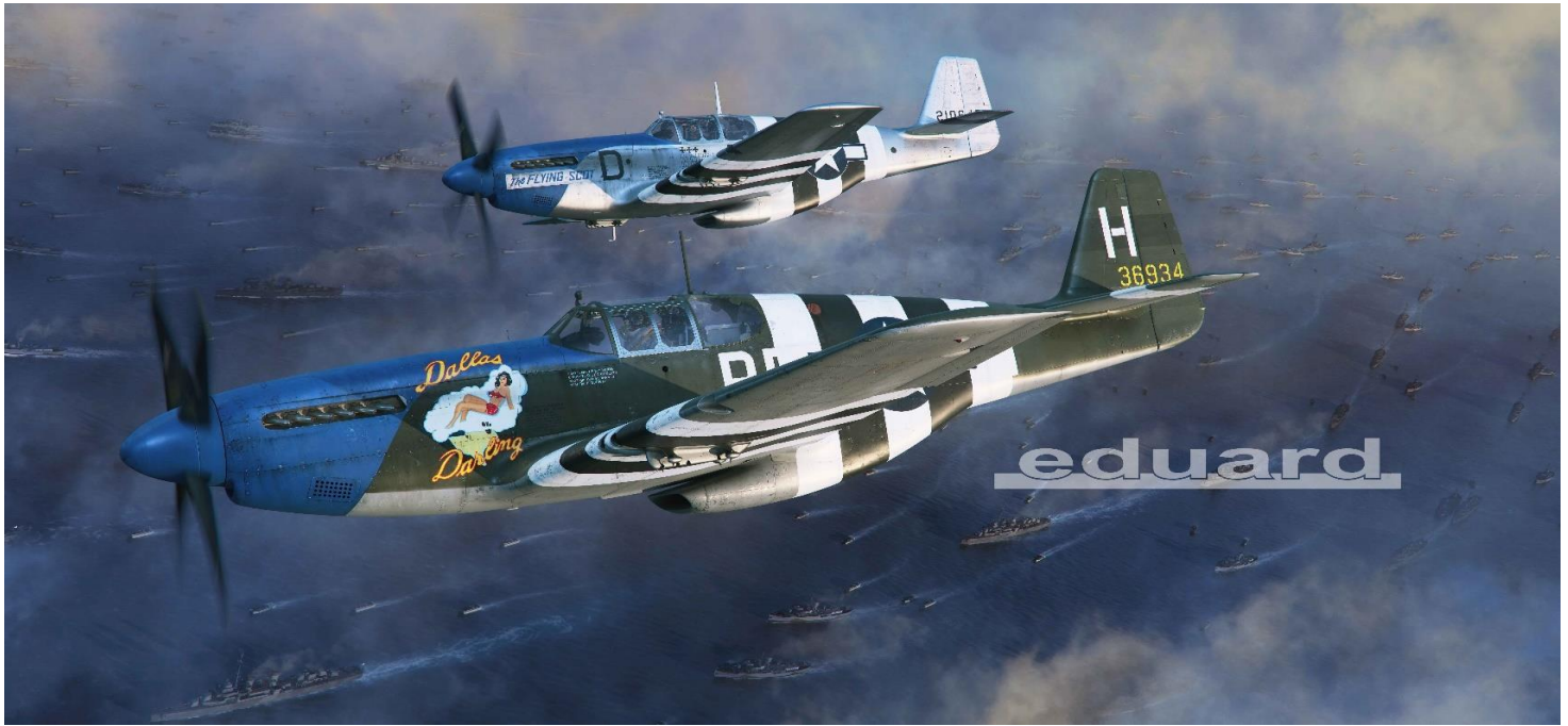
370 x 522mm (縁を含む) フルカラーポスター ※付属するポスターにはエデュアルドのロゴマークは印刷されていません