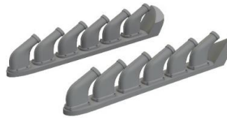
1/48 P-51B/C 排気管