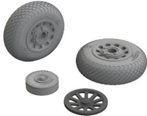
1/48 P-51B/C ホイール (十字トレッド)