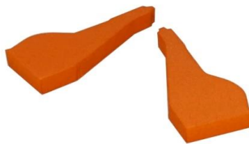
ウレタンフォーム製着陸 装置格納庫塗装マスク