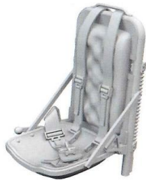
1/48 P-51B/C 操縦席2 (3Dプリンター製、 ベルトモールド付き)