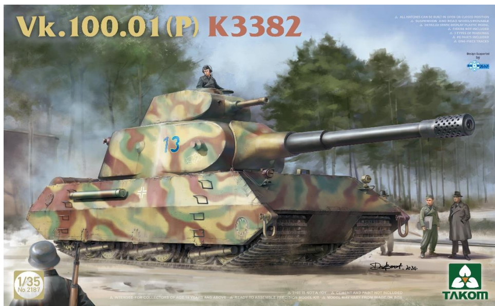
Vk100.01 (p) K3382