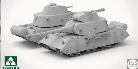
Vk100.01 (p) K3382