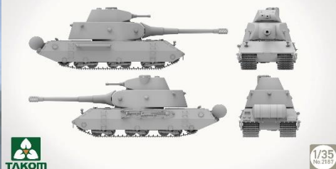
Vk100.01 (p) K3382