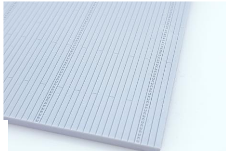
ディスプレイベースの表面ディテール

ダウンロード可能な3Dプリントデータのパーツ: 着艦ワイヤー用金具・爆弾台車・ホイールチョック(米軍式 & 英軍)