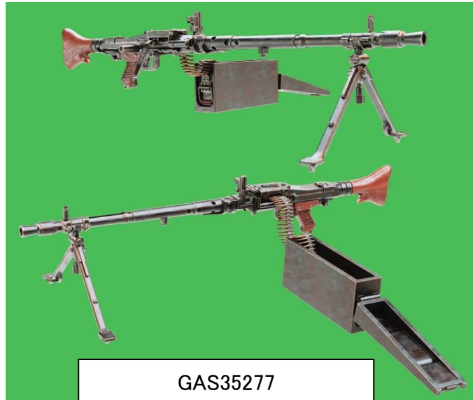
GAS35277 ・「車両用」P型を再現 ・折り畳み状態バイポッド/展開状 態バイポッド x 各2個入 ・軟質樹脂製弾帯パーツ x 2個入