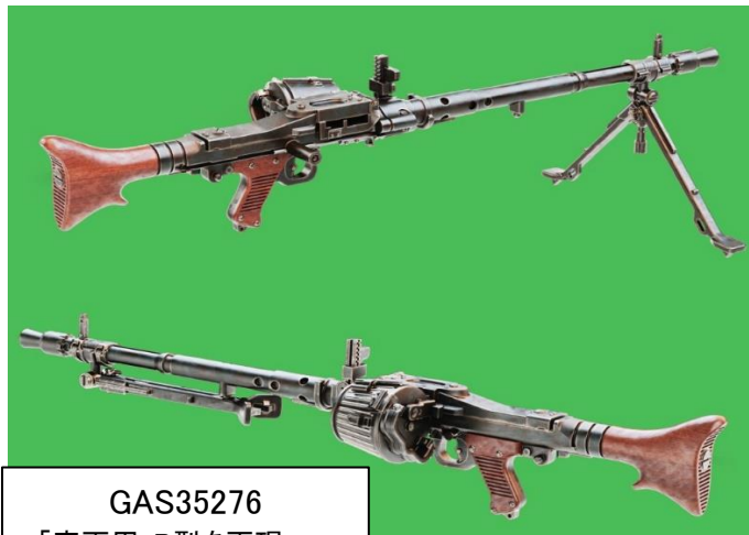
GAS35276 ・「車両用」P型を再現 ・折り畳み状態バイポッド/ 展開状態バイポッド x 各2個入