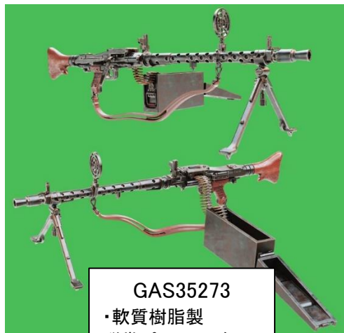
GAS35273 ・軟質樹脂製 弾帯パーツ x 2個入