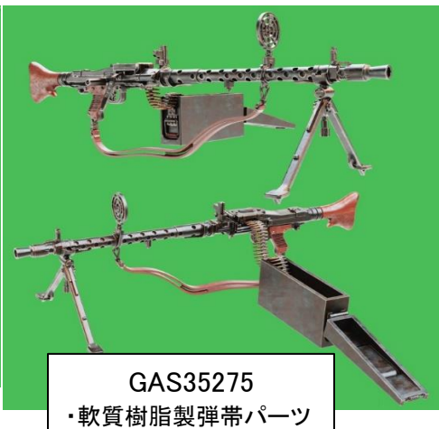
GAS35275 ・軟質樹脂製弾帯パーツ x 2個入