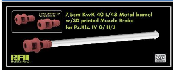
← 金属砲身 + 3Dプリンター製マズルブレーキ