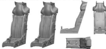
Martin Baker CG-A Seat