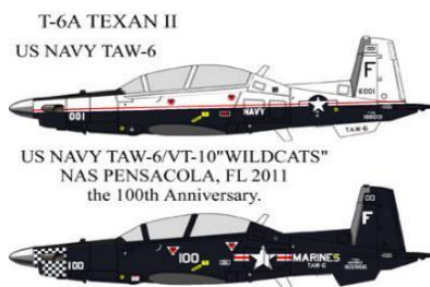
FXNA035 アメリカ海軍仕様。マーキング2種。

T-6 テキサン II はアメリカをはじめ、世界各国で採用されている練習機です。ピラタス社の開発したPC-9を改良した機体で、練習機として成功を収めたT-6 テキサンに因み「テキサン II」の愛称が付けられました。1995年にアメリカ空軍・海軍の共同初等練習機として採用が決まり、1999年より量産機が配備されています。航空自衛隊でもT-7の後継にT-6 テキサン II が選定されました。