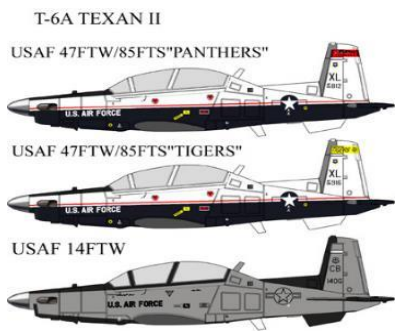
FXNA034 アメリカ空軍仕様。マーキング3種。