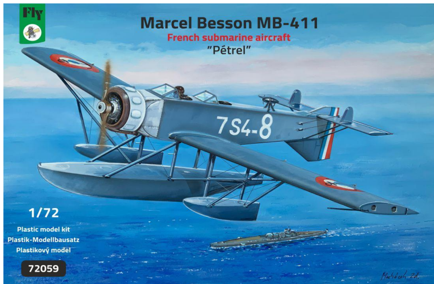
Marcel Besson MB-411 French submarine aircraft "Pétrel"

チェコのフライから 完全新金型 の1/72スケール航空機インジェクションプラスチックキットと3Dプリンター製専用アフターパーツ計2点のご案内です。この機会に是非ご検討をお願いします。