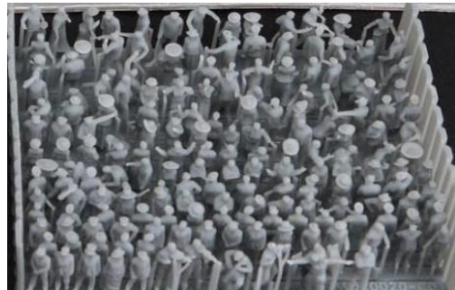
Tori Factory設計の3Dプリンター製フィギュア180体