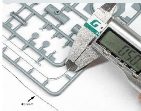
Measure & Replace