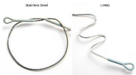
Softer than Stainless Steel