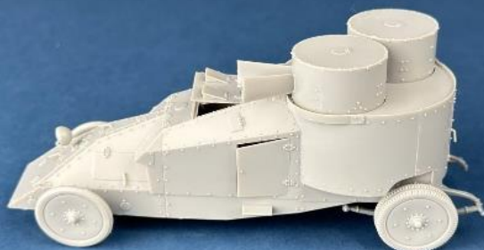
メーカーによる 組立例です