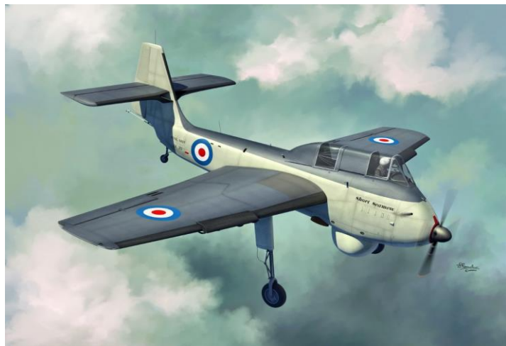
Short SB.6 Seamew

チェコのソードから 完全新金型 の1/72 ショート SB.6 シーミューのご案内です。シーミューは1953年に初飛行した、イギリスで試作された艦上対潜哨戒機です。本機はアームストロング・シドレーマンバ ターボプロップエンジンを装備した単発機で、コクピットは視界を確保するため機首前部ギリギリの位置に配置され、対潜レーダーは機首の真下に装備しました。このレイアウトにより機首の下部に車輪を格納することができなかったため降着装置は尾輪式が採用され、主/尾脚は機体構造の簡素化や重量軽減のため固定脚となりました。艦上任務のため主翼は主脚の外側の位置から折りたたむことが可能でした。武装は胴体内に設けられた爆弾倉に魚雷、爆雷等を搭載するほか、主翼のパイロンにロケット弾や小型爆弾を装備することができました。軽量で安価な機体として開発された本機は、防衛費削減により配備予定だったRNVR(海軍義勇予備隊)が解体されたため、わずか19機の生産に留まりました。キットには塗装マスクシールと2種デカールが付属しています。完成時には全長約174mm、全幅約233mmとなります。ソードのキットはパネルラインが繊細なマイナスモールドでディテールも良好です。付属のデカールも非常に良質で発色の良いものが付属しています。