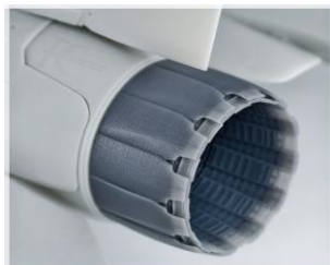
RKS720103T/F/G 72 F-14B/D "TOMCAT"

中国の3Dプリンター製アフターパーツメーカー、ロキットスタジオから新商品の1/72スケール F-14B/D トムキャット アフターバーナー6点のご案内です。どのセットも塗装マスクシールが付属しています。ロキットスタジオのディテールアップパーツは実物のパーツを精密なディテールで忠実に再現しています。