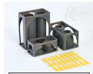
RKS720104T/F/G パーツの構成です