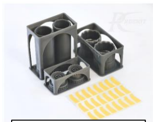
RKS720103T/F/G パーツの構成です