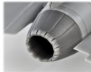
RKS720104T/F/G 72 F-14B/D "TOMCAT"