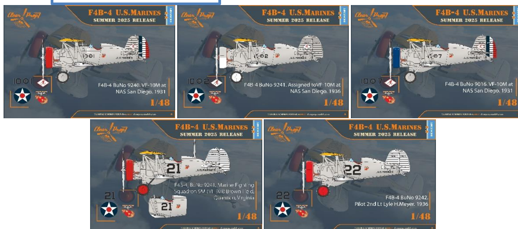
CPU4827のマーキング オプションです