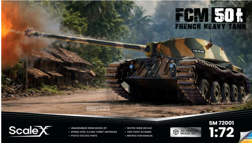
キットパーツの構成です

ウクライナのスケールXから、新商品の3Dプリンター製 1/72 フランス FCM 50t 重戦車組み立てキットのご案内です。FCM 50tは1945年にForges et Chantiers de la Méditerranée社が、フランスのARL 44戦車と戦争賠償のパンター中戦車の後継として計画したものです。車体のデザインはV号戦車に、砲塔はティーガーⅡに似た本車は武装に90mm主砲と7.5mm機関銃を2丁搭載することが計画されていました。1945年12月にデザインは固まりましたが、フランス軍がAMX 50を選定したことでFCM 50tは計画のみにおわりました。今回ご案内する商品は3Dプリンター製パーツにエッチングパーツ、アンテナ用金属線と2種デカールが付属しています。