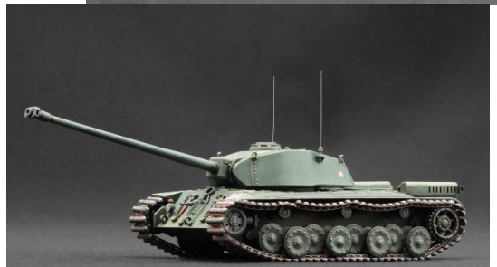
画像はメーカーのウェブサイト https://scalex.art/en/