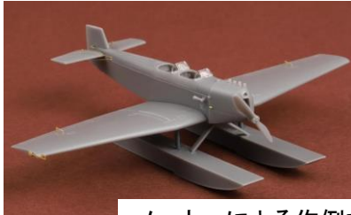
メーカーによる作例です