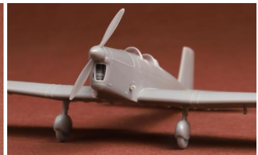
メーカーによる作例です