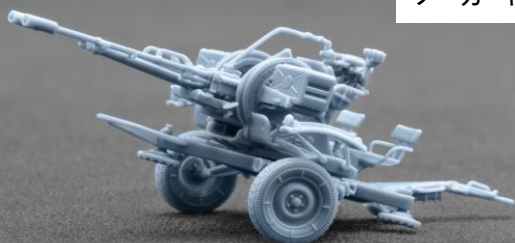
メーカーによる作例です