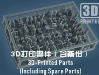
3D打印零件 (含备份) 3D-Printed Parts (Including Spare Parts)