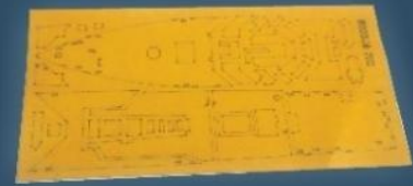
遮盖紙 Masking Sheet