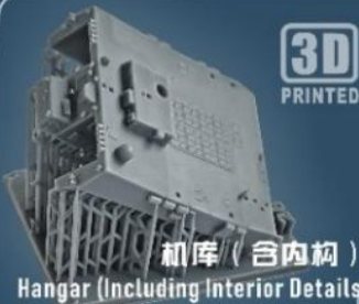
3D PRINTED 机库 (含内构) Hangar (Including Interior Details)