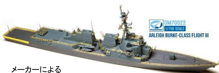
メーカーによる 未塗装作例です