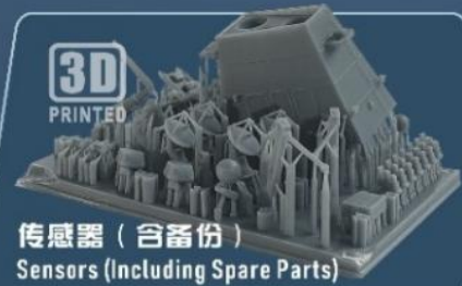
3D PRINTED 传感器 (含备份) Sensors (Including Spare Parts)