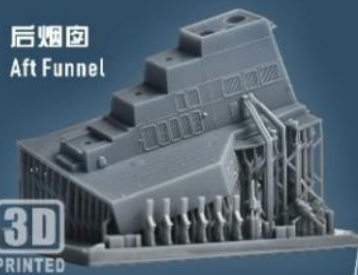
后烟囱 Aft Funnel