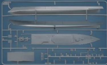
射出零件 Injection-Molded Parts